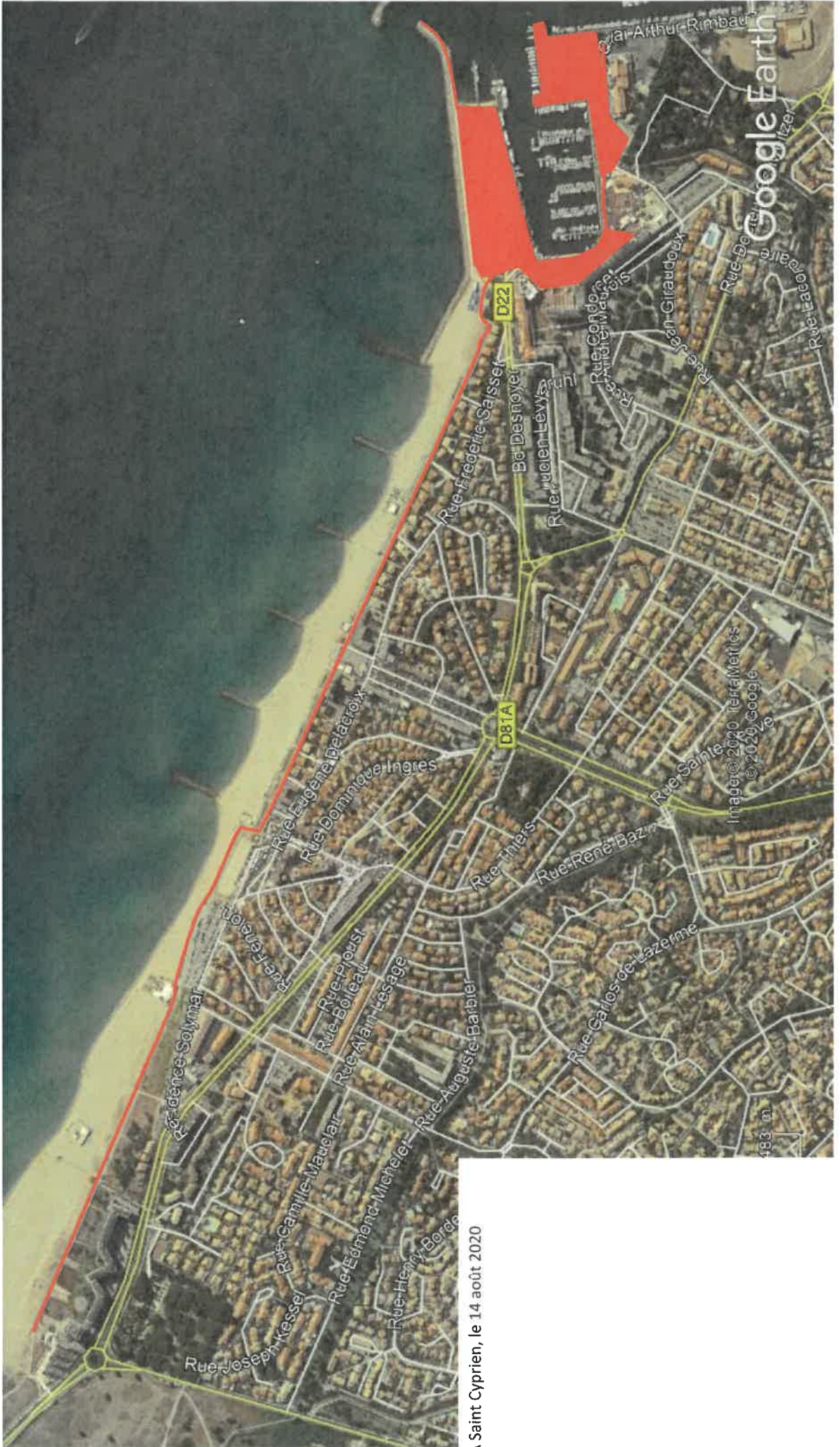
A Saint Cyprien, le 14 août 2020