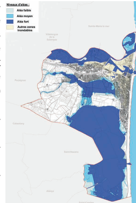
Carte d'aléa inondation fluviale

La modélisation mathématique a été réalisée à l'aide des crues de référence (1940 pour la Têt et la crue centennale pour les Llobères) en tenant compte du contexte topographique d'aujourd'hui et des aménagements de protection réalisés par la commune.