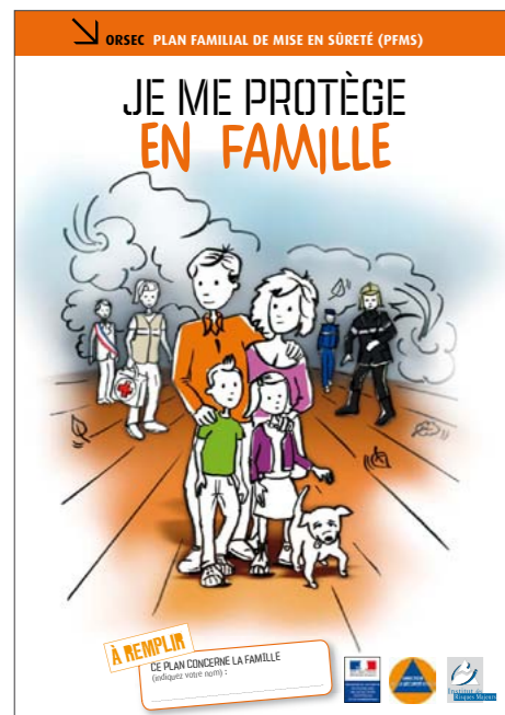
Couverture du guide