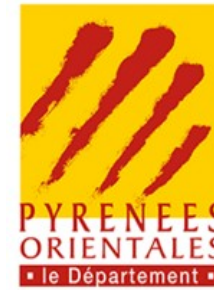
SCHÉMA DÉPARTEMENTAL D'AMÉLIORATION DE L'ACCESSIBILITÉ DES SERVICES AU PUBLIC