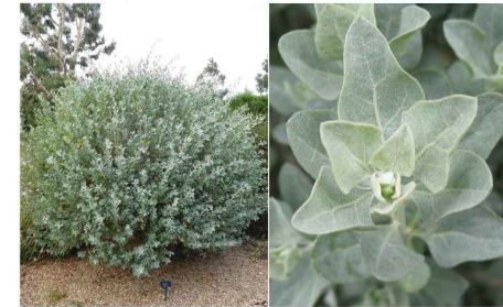
Atriplex halimus Pourpier de mer At.ha

Réintégration des essences horticoles locales