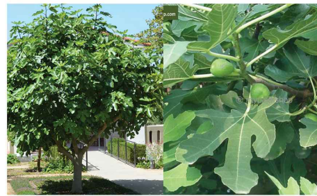
Ficus carica Figuier Fi.ca