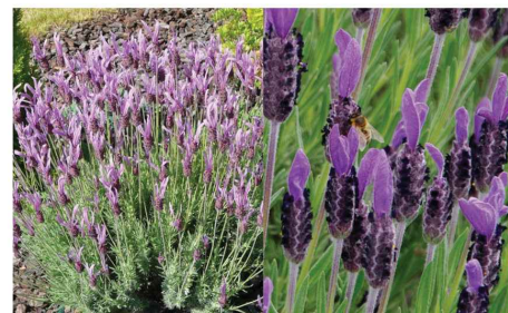
Lavandula stoechas Lavande à toupet La.st