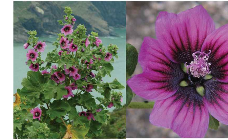
Malva arborescens Lavatière Ma.ar