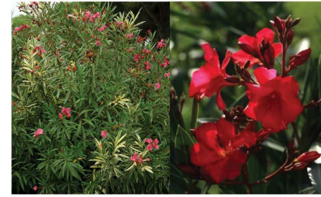
Nerium oleander Laurier rose Ne.ol