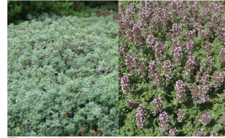
Thymus ciliatus Thym cilié Th.ci