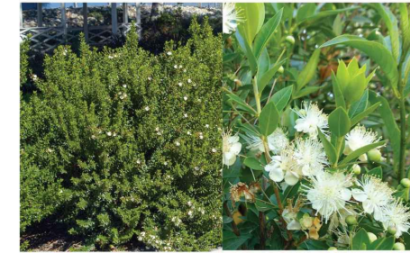
Myrtus communis Myrte commun My.co