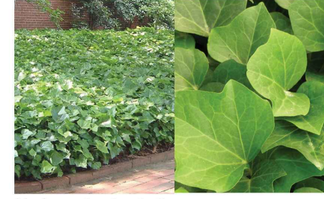
Hedera algerian bellecour Lierre He.al