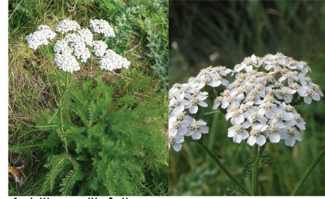
Achillea millefolium Achillée millefeuille Ac.mi