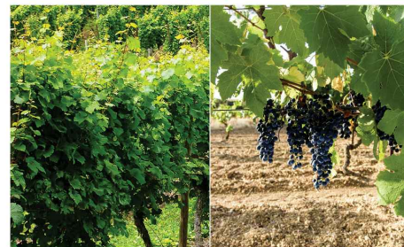
Vitis vinifera Vignes Vi.vi