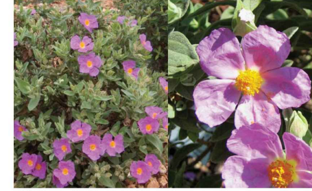
Cistus albidus Ciste cotonneux Ci.al