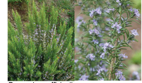
Rosmarinus officinalis Romarin Ro.af