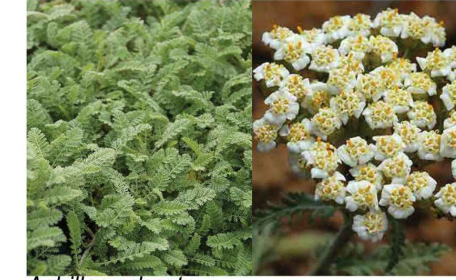
Achillea odorata Achillée odorante Ac.od