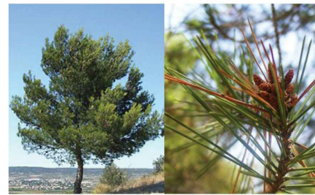
Pinus halepensis Pin d'Alep Pi.ha