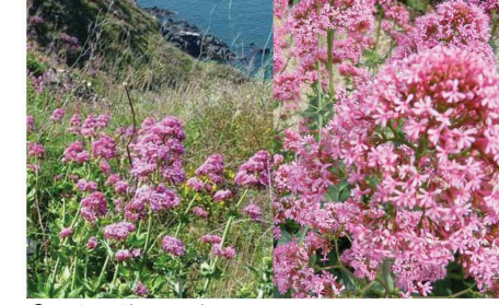
Centranthus ruber Valériane rouge Ce.ru