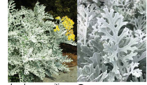
Jacobaea maritima Céneçon cinéraire Ja.ma