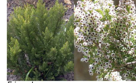
Erica arborea Bruyère arborescente Er.ar